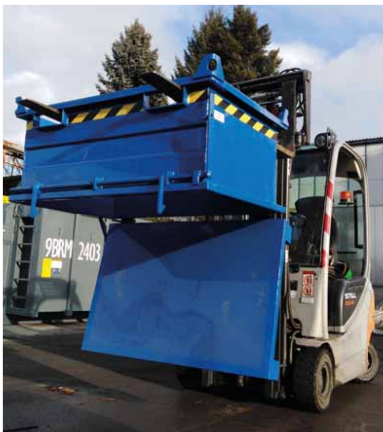
VBB 1500 - fundul în poziție deschisă